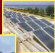
राष्ट्रीय विकासासाठी उर्जा