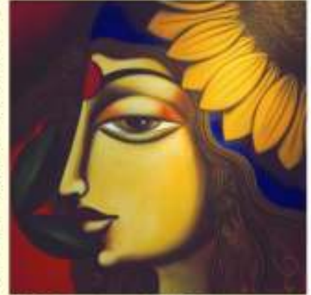
छत्रपती राजा तैड्याजी तटलेच्या 'छत्रपती भवन'ला प्रथम पल्लांग विद्यापीठाने अनेक राष्ट्रीय, आंतरराष्ट्रीय चित्रकारांची मांदियाळी कला भवनच्या सज्जुसज्जेत उघडता येईल आहे. कला भवनला आलेख पारितोष तर संपन्न कला विद्यार्थ्यांसाठी अनेक नामवंत चित्रकारांची प्रदर्शने या सज्जुसज्जेत भरवली आणि कला संस्थानातही त्यांचा भरभरून प्रतिसाद दिला आहे.